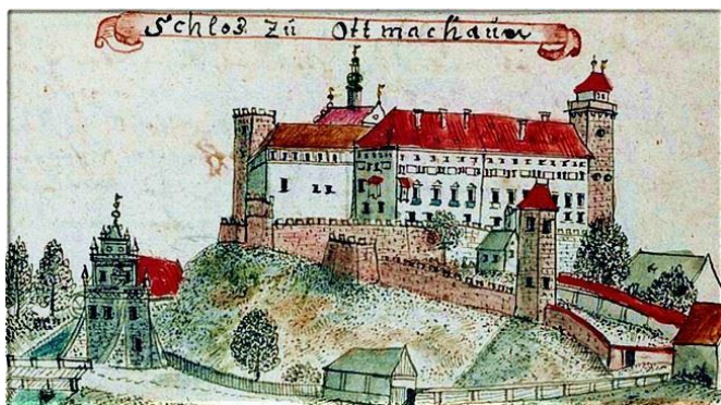
Rys. 3. Zamek w połowie XVIII w. ryc. CH.F.B. Wernhera, źródło: Leksykon Zamków w Polsce, L. Kajzer,

S. Kołodziejski, J. Salm, Arkady 2002 http://www.zamkipolskie.com/otmuchow/otmuchow.html