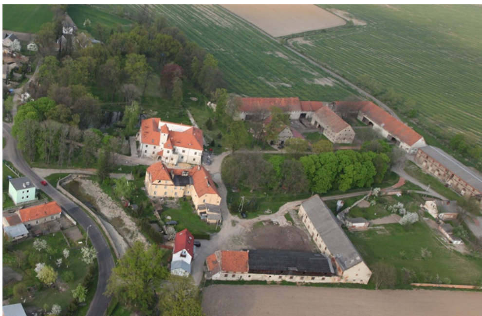
Zdjęcie nr 1. Zespół pałacowo folwarczny z parkiem, Piotrowice Nyskie, 2011

W gminie Otmuchów najważniejszym zespołem rezydencjonalnym jest zamek Otmuchowski z dziedzińcem i parkiem. Jest własnością komunalną i obecnie pełni funkcje o charakterze hotelowo - gastronomicznym. Obiekt nie posiada ekspozycji muzealnej, jest udostępniony do zwiedzania dla grup oraz turystów indywidualnych.