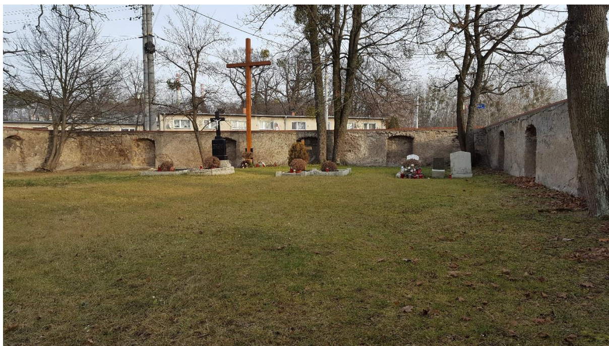
Zabytkowy cmentarz w Choruli