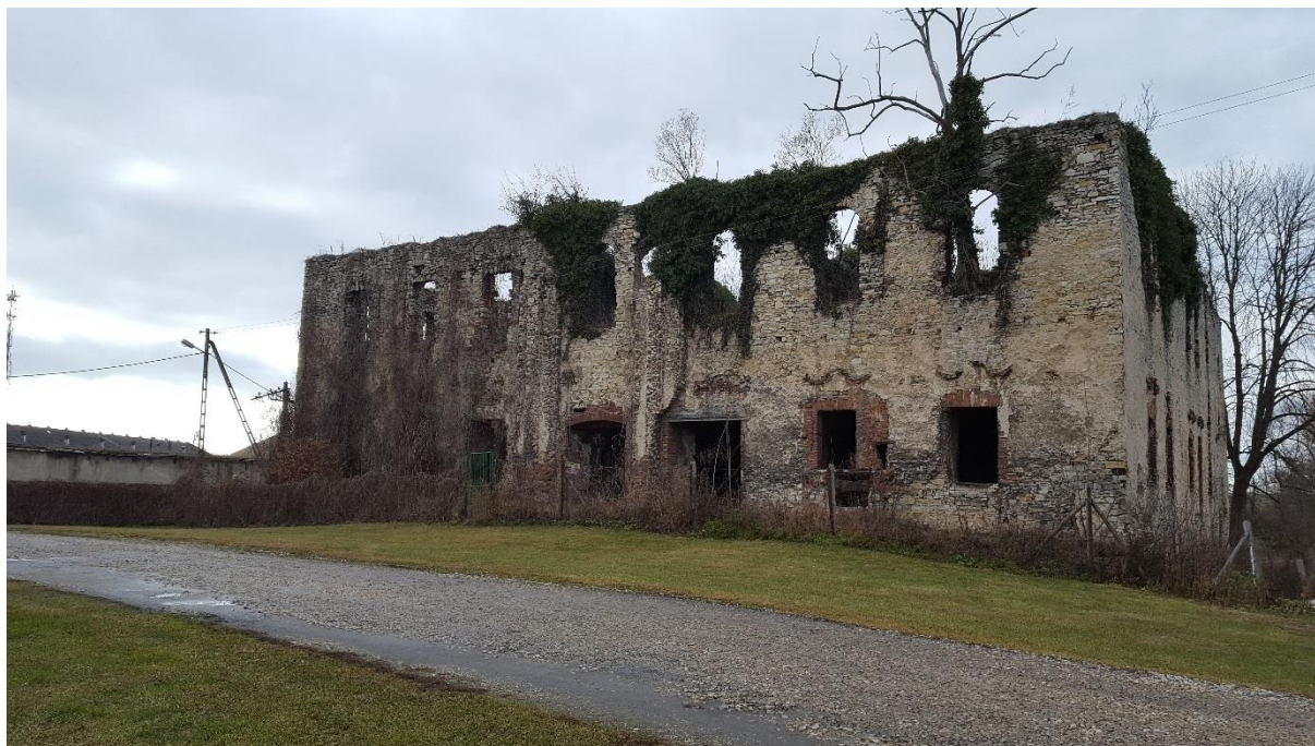
Ruiny pałacu w Zakrzowie