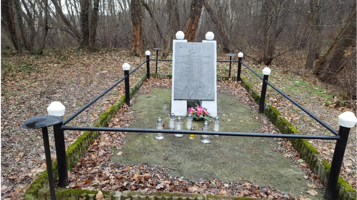
Zbiorowa mogiła mieszkańców gminy Gogolin w Zakrzowie