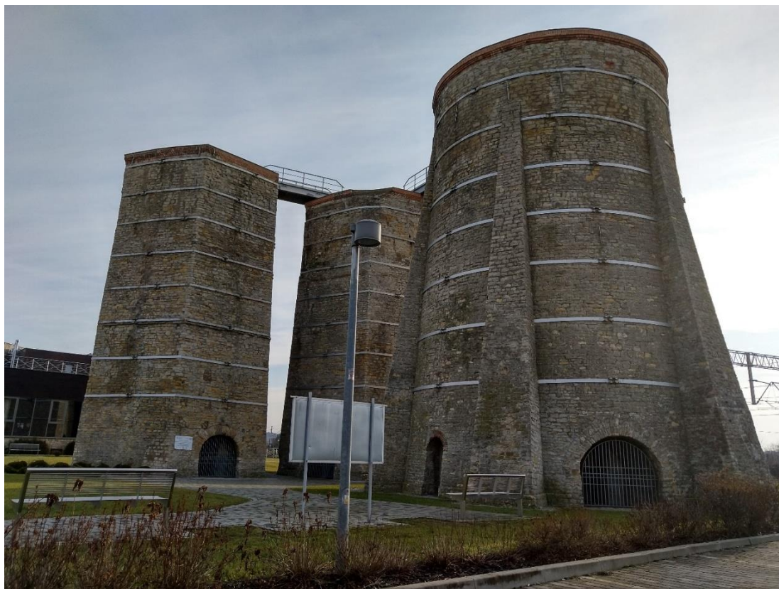
Bateria trzech pieców szybowych w Gogolinie

Bateria pieców szybowych znajdująca się na działce nr 656/17 została wpisana do rejestru na podstawie decyzji nr 196/2012 z dnia 25.10.2012r. Przed dokonaniem wpisu zabytek ten poddano kompleksowemu remontowi, dzięki któremu odzyskał wartości historyczne. Zabiegi remontowe przeprowadzono również w otoczeniu pieców, co pozwala na dokładną obserwację walorów całego zespołu. Stan zabytku określa się jako bardzo dobry.