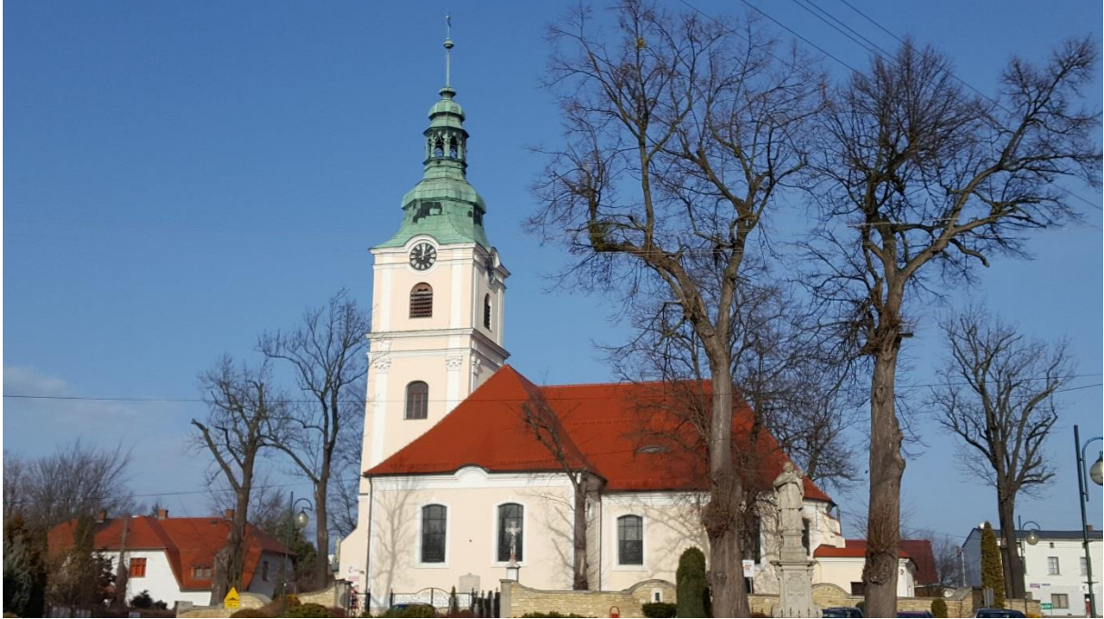
Kościół w Kamieniu Śląskim

Pierwsza wzmianka o kościele parafialnym pw. Św. Urbana w Kamieniu Śląskim pochodzi z roku 1271r. Ten drewniany kościół spłonął jednak w czasie wojny 30-letniej. Na jego ruinach w latach 1605 – 1632 zbudowano nową świątynię w stylu barokowym. Po kanonizacji patronem kościoła został pochodzący z Kamienia św. Jacek. W latach 1909 – 1910 został rozbudowany o dwie boczne nawy. Obiekt jest poddawany regularnym remontom, dlatego jego stan określa się jako bardzo dobry.