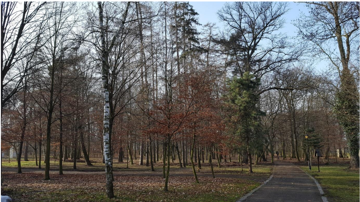
Park przypałacowy w Kamieniu Śląskim

Park wokół pałacu zachował główne osi widoków. Jest na bieżąco pielęgnowany i oczyszczany. Stan: dobry.