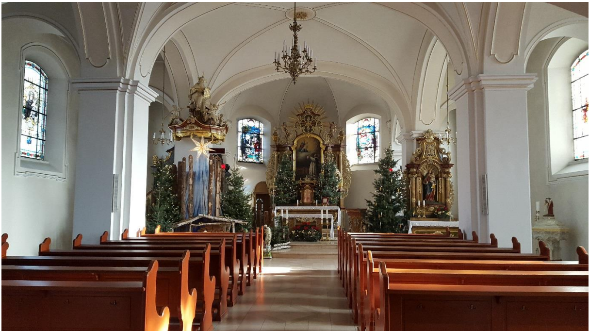
Wnętrze kościoła w Kamieniu Śląskim

Budynek wozowni w zespole pałacowo-parkowym został wyburzony w czasie remontu.