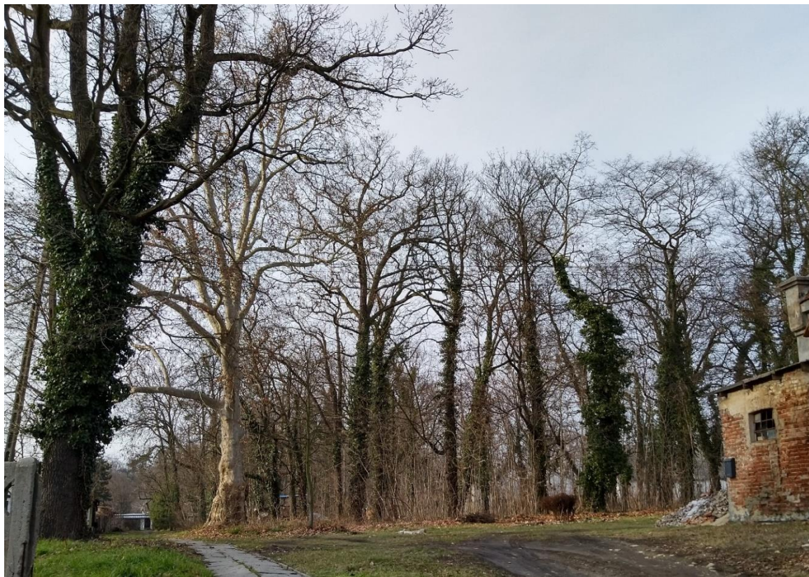
Zabytkowy park w Obrowcu