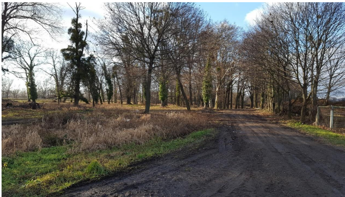
Zabytkowy park za Placem Wiejskim w Choruli

Do rejestru zabytków województwa opolskiego na podstawie decyzji nr 122/85 z dnia 02.01.1985r. wpisano pozostający w rękach prywatnych park. Występują w nim chronione gatunki takie jak: tulipanowiec amerykański, platany, stary wiąz, lipa drobnolistna, a także iglicznia trójcieniowa. Obiekt ten nie jest pielęgnowany ani oczyszczany, dlatego jego stan można określić jako zły.