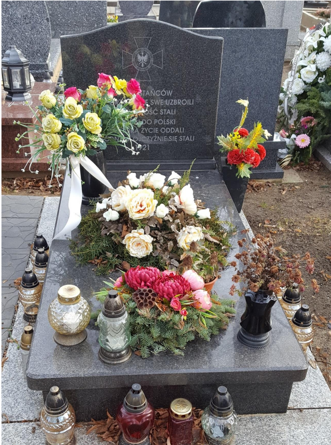
Zbiorowa mogiła Powstańców Śląskich w Gogolinie

W złym stanie pozostaje natomiast znajdujący się pod opieką Gminy Gogolin cmentarz żydowski, na którym regularnie wykonywane są prace pielęgnacyjne zieleni.