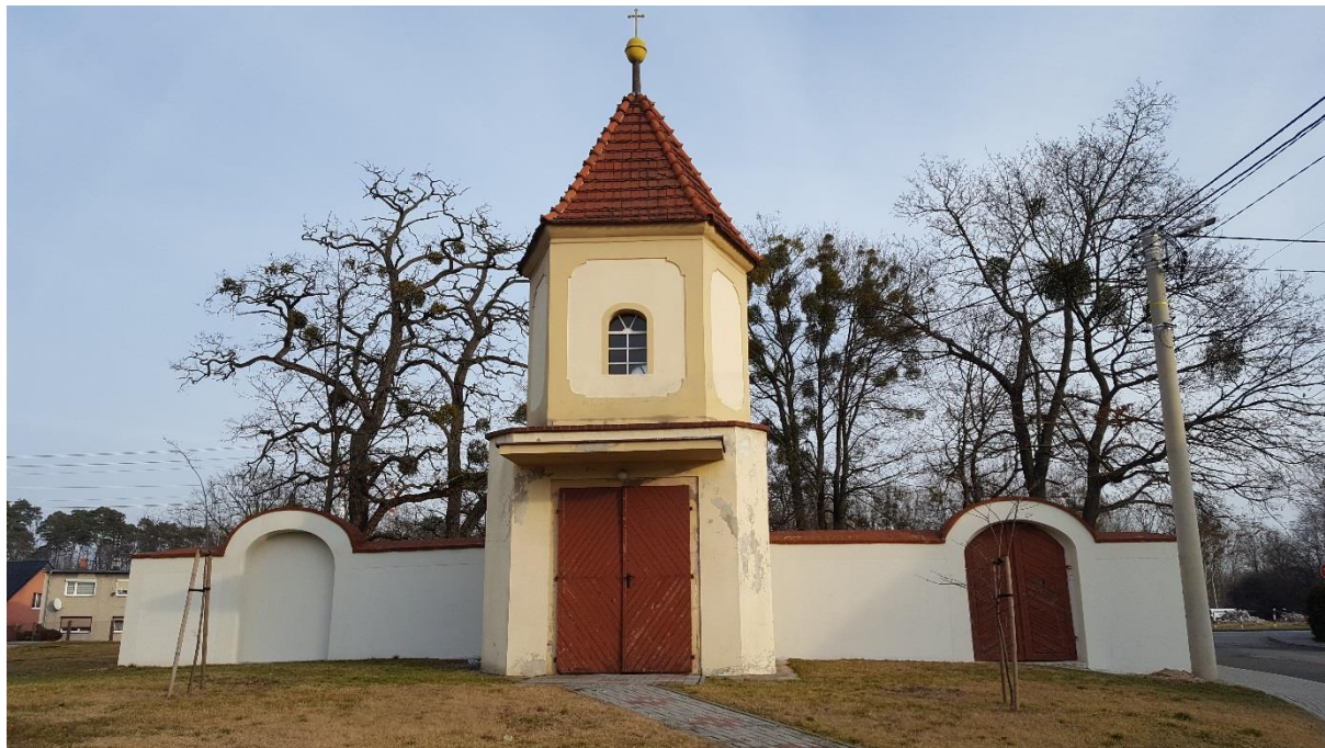
Ogrodzenie cmentarza w Choruli

okolicznych mieszkańców. Obiekty budowlane zostaną w ciągu najbliższych lat poddane remontom, obecnie ich stan określa się jako zły.