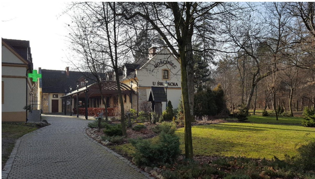
Dawny budynek stajni w zespole parkowo-palacowym w Kamieniu Śląskim