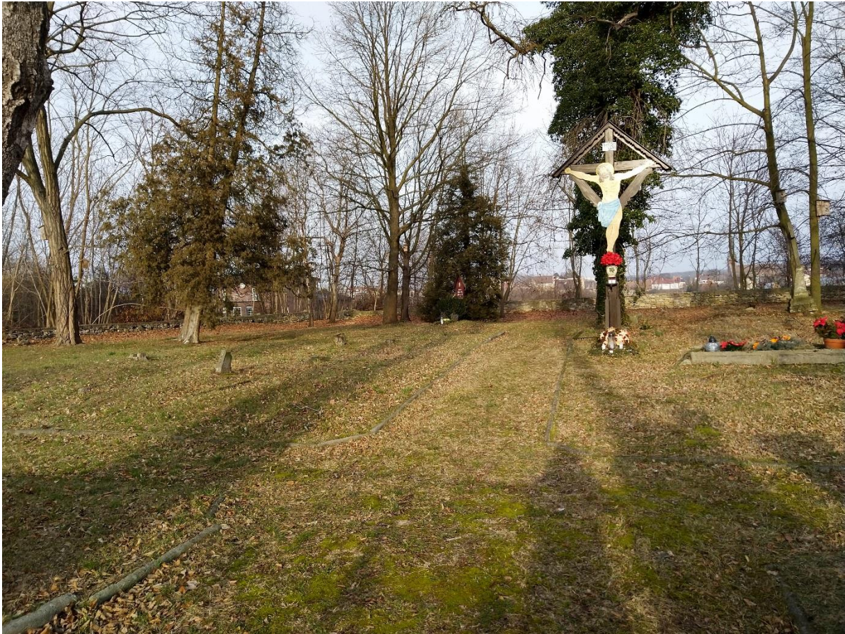
Cmentarz żydowski w Gogolinie

W 2015 r. gruntowną renowację przyszyły organy znajdujące się w kościele parafialnym w Gogolinie. Wymienione zostały wewnętrzne zespoły instrumentu i klawiaturę, remontowi poddano również zewnętrzną część zabytku, którego jest określa się jako bardzo dobry.