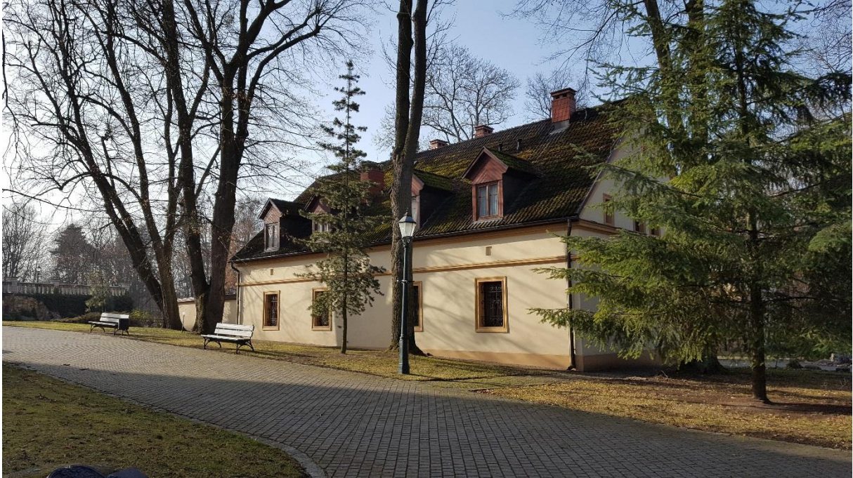
Dawny budynek mieszkalny dla służby pałacowej w Kamieniu Śląskim

Park wokół pałacu zachował główne osi widoków. Jest na bieżąco pielęgnowany i oczyszczany. Stan: dobry.