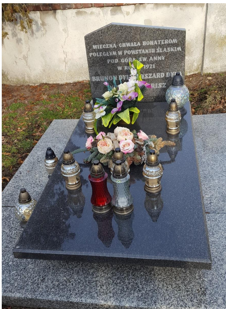
Zbiorowa mogiła Powstańców Śląskich w Obrowcu