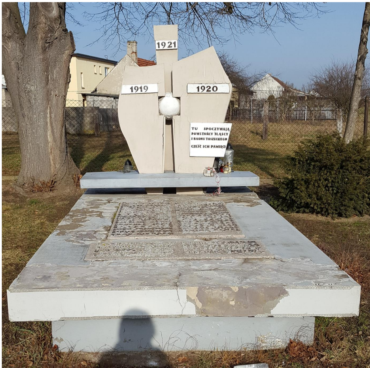
Zbiorowa mogiła Powstańców Śląskich w Kamieniu Śląskim

Pałac w Kamieniu Śląskim od grudnia 1945 r. został zaadaptowany na Państwowy Dom Dziecka, który działał w tym miejscu do 1954 r, kiedy to zmodernizowano znajdujące się w sąsiedztwie lotnisko przeznaczając je na cele militarne. Zamek został włączony do kompleksu wojskowego i zamieszkali w nim żołnierze Armii Radzieckiej. Wojskowi lokatorzy doprowadzili pałac do ruiny. W 1971 r. zamek uległ pożarowi, który dokończył dewastację. Obiekt znalazł się pod opieką Wojska Polskiego, które nie podjęło prób remontu ani zabezpieczenia zabytku przed dalszym niszczeniem. Pod koniec lat osiemdziesiątych pałac został przekazany Gminie Gogolin, a wojewódzki konserwator zabytków rozpoczął jego odbudowę. Z powodu braku środków finansowych prace zostały przerwane jeszcze przed położeniem nowego dachu. Przełomowym momentem stał się 14 grudnia 1990 r. kiedy to władze Gminy Gogolin na podstawie umowy przekazały ruiny zamku diecezji opolskiej. Intensywne prace remontowe trwały 4 lata, dzięki którym pałac wraz z obiektami towarzyszącymi wrócił do dawnej świetności. Jego stan określa się jako bardzo dobry.