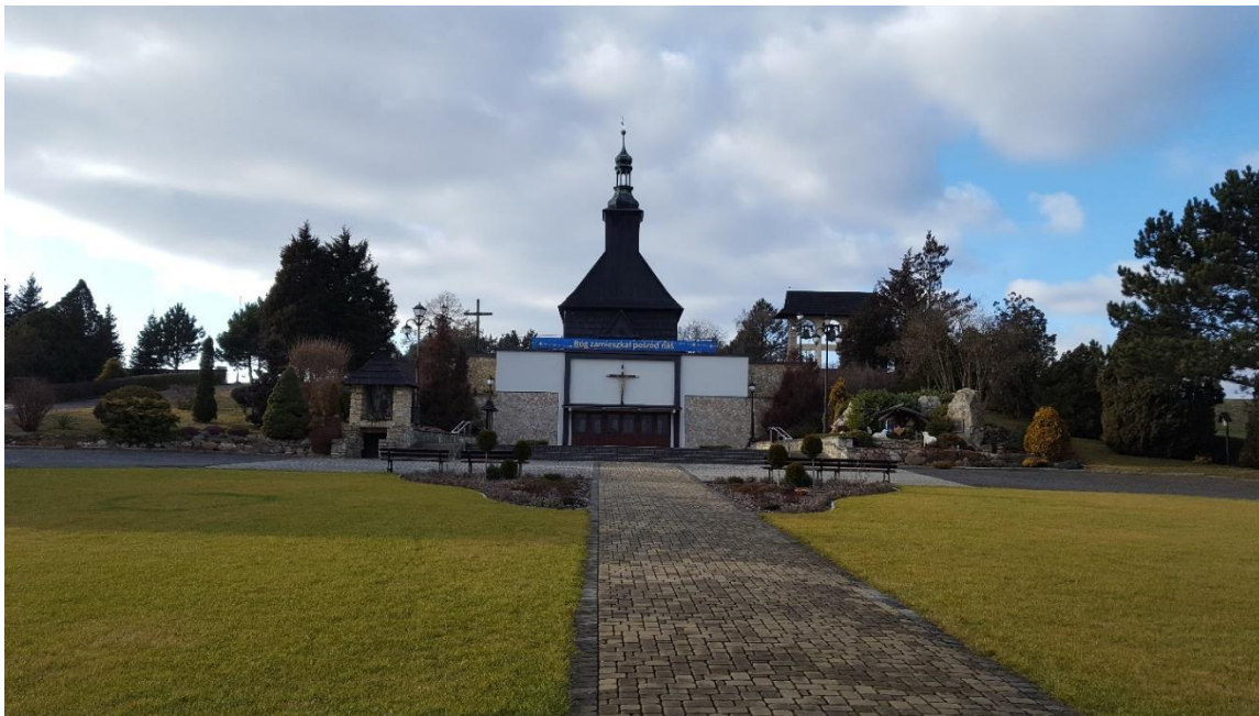
Kościół w Malni