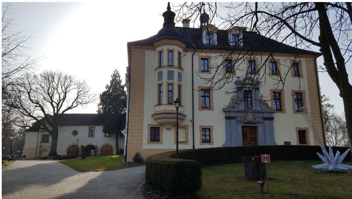
Pałac w Kamieniu Śląskim