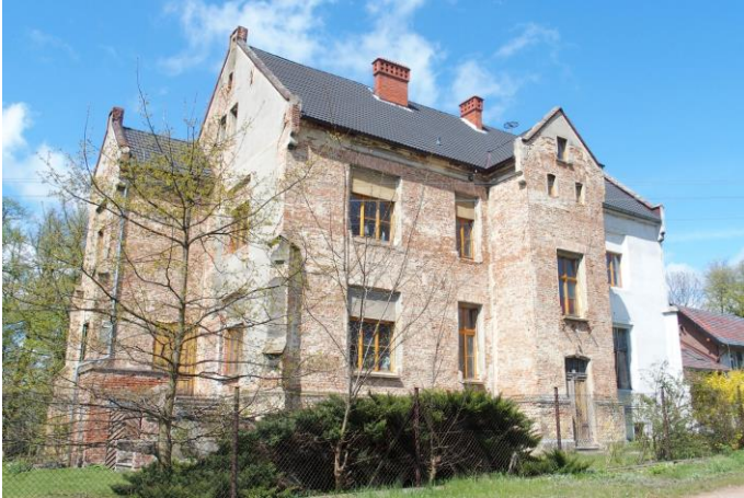
Zdjęcie nr 8. Dwór w zespole w Dobieszowicach, ul. Kozielska 32

Budynek murowany z cegły, potynkowany, wzniesiony na planie prostokąta, ze znacznymi ryzalitami na osiach elewacji frontowej i ogrodowej oraz ryzalitem w elewacji bocznej. Dwór podpiwniczony, dwukondygnacyjny, nakryty dachami dwuspadowymi. Budynek znacznie przekształcony, za wyjątkiem niewielkich szkarp pozbawiony pierwotnych podziałów i detali, w drugiej kondygnacji zmieniono również wielkość otworów okiennych. Obecnie własność prywatna, brak możliwości zwiedzania, teren ogrodzony. W otoczeniu dworu budynki gospodarcze dawnego folwarku.