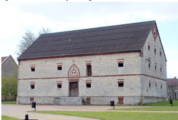
Zdjęcie nr 14. Spichlerz folwarczny w zespole w Broźcu, ul. Reymonta 95