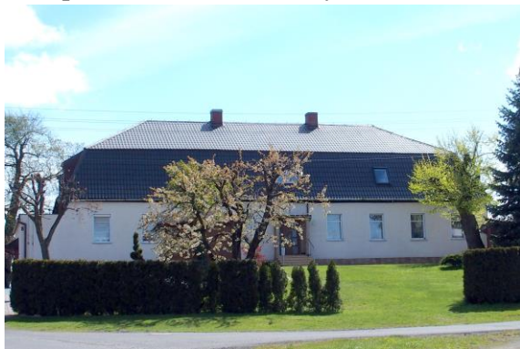
Zdjęcie nr 13. Dwór w zespole w Walcach, Plac Górny 8

Dwór z Walcach wzniesiony najprawdopodobniej w 2 poł. XVIII w., usytuowany w centralnej części wsi na zachodnim stoku niewielkiego wzniesienia, był remontowany i gruntownie odnawiany w 1 poł. XX w. Budynek był siedzibą zarządcy majątku. Budynek parterowy, o konstrukcji szkieletowej, potynkowany, częściowo podpiwniczony, kryty dachem mansardowym z powiekami i współczesnymi lukarnami. Założony na