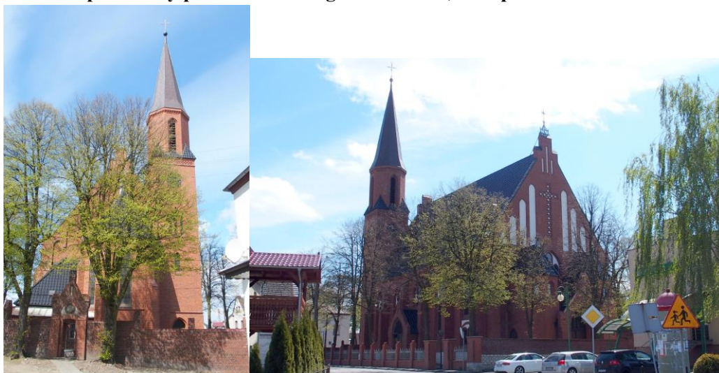
Zdjęcia nr 6, 7. Kościół parafialny pw. św. Walentego w Walcach, ul. Opolska