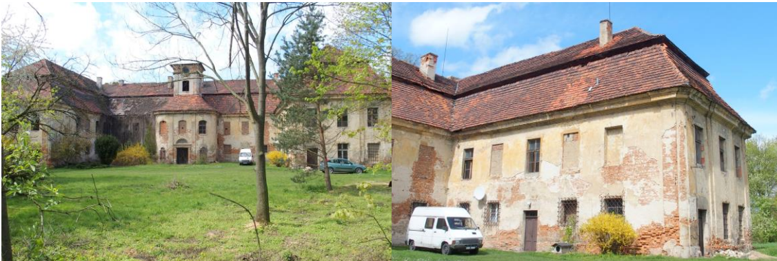
Zdjęcia nr 9, 10. Pałac w zespole w Rozkochowie, ul. Głogowska