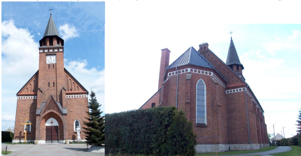
Zdjęcia nr 4, 5. Kościół parafialny pw. Najświętszego Serca Pana Jezusa w Straduni, ul. Opolska