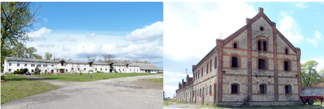
Zdjęcia nr 11, 12. Bud. mieszkalno-gospodarczy i gospodarczy w zespole w Rozkochowie, ul. Głogowska