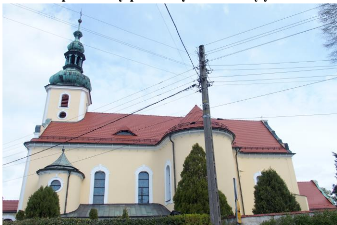
Zdjęcie nr 1. Kościół parafialny pw. Wszystkich Świętych w Brożcu, ul. Reymonta 52