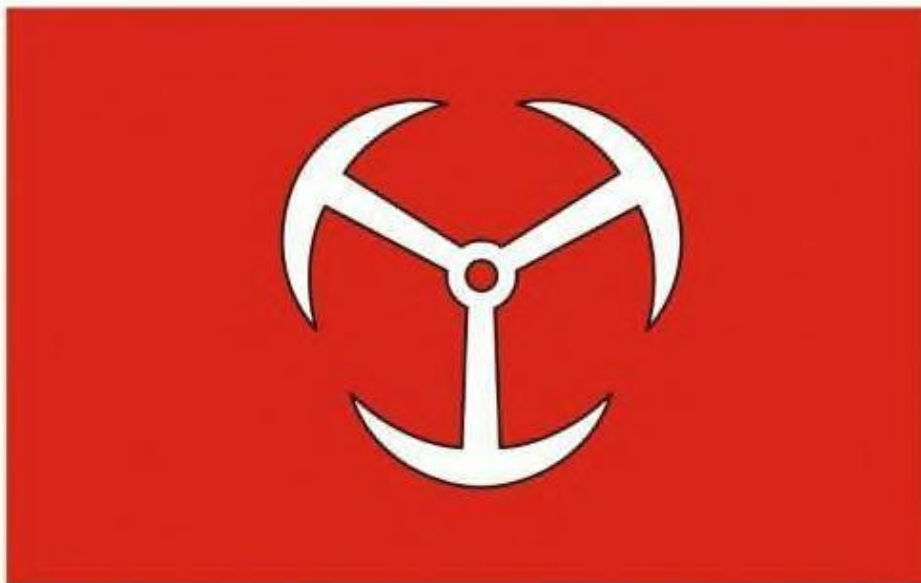
Flaga, proporcje 5:8